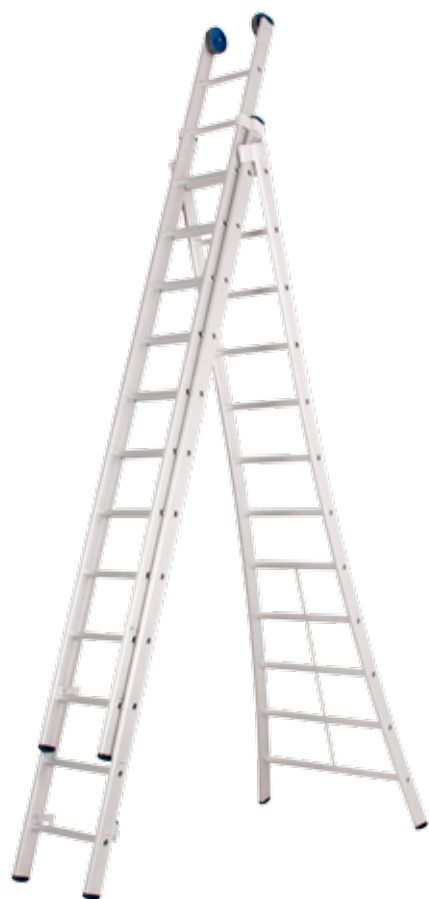
3-DELIGE LADDER 12 SPORTEN / ECHELLE 3 PARTIES 12 ECHELONS